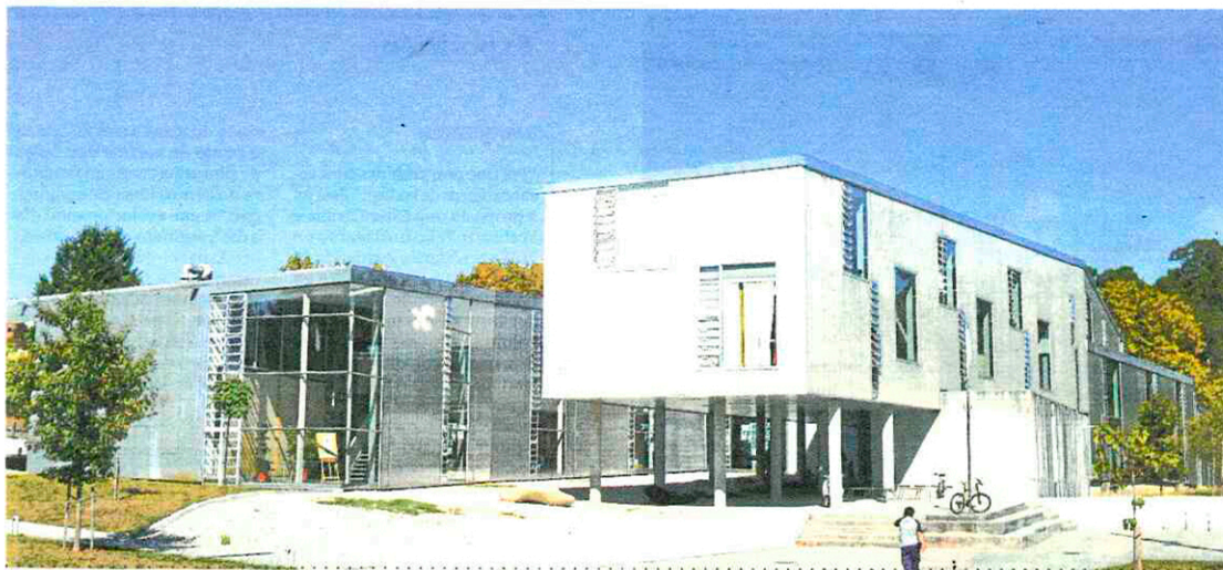
A xornada desenvolverase na Facultade de Ciencias da Educación e do Deporte.