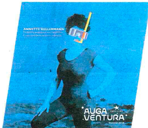
Carta do programa Augaventura Outono 2018.

Flyboard e Paddlesurf serán as primeiras actividades que se presentan do programa. A primeira ofrece dous grupos, un o 29 de setembro no Club Náutico Raxó, e o outro o 20 de outubro no Liceo Marítimo de Bouzas. O