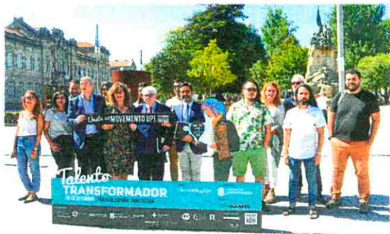
Foto de familia de organizadores e patrocinadores do Pont-Up Store.