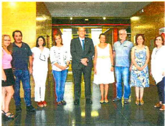
Imaxe de parte dos seus membros antes da constitución.