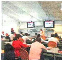
Un intre da reunión.

do departamento de Caldas, que conforman a alianza SUMA, e nas que estudan uns 40.000 alumnos e alumnas. Unha delegación integrada por representantes políticos e empresariais dos departamentos de Caldas e Risalda, coñecido como o Eixo Cafeteiro, mantiveron recentemente no campus de Vigo un encontro no que, ademais de coas universidades da alianza SUMA, tamén se abriu a porta á colaboración co mundo empresarial da rexión colombiana.