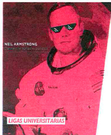
Carta desta edición das Ligas Universitarias.

Por segundo ano consecutivo, os arbitaxes das Ligas Universitarias dos tres campus realizaranse grazas aos convenios coas distintas federacións.