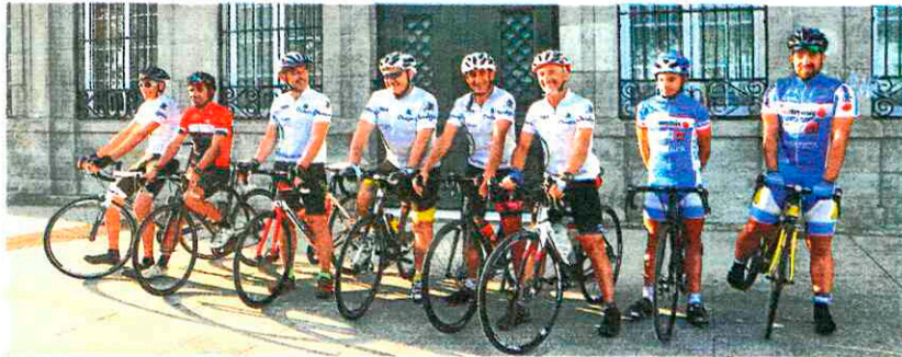
Foto de familia dos corredores que este luns tomaron a saída en Vigo.

pas duns 120 quilómetros cada una, que unirán Santiago, Oviedo, León e Salamanca, onde, nas súas respectivas universidades, ofrecerán charlas sobre temas de actualidade en