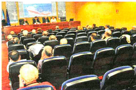
Os pasados venres e sábado celebráronse en Vigo os XXVIII Encuentros Humbolt.

Menéndez referiuse aos feitos máis destacados da historia das ciencias mariñas en España, ao tempo que repasou os datos máis salientables da actividade do CSIC no ámbito mariño. A presidenta do Centro Superior de Investigaciones Científicas tamén se referiu na súa intervención o traslado do centro de Vigo á ETEA, asegurando que "espero que o próximo ano selance o proxecto e a principios de 2023 ou finais de 2022 podamos inaugurar o novo edificio".