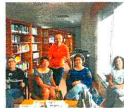
Impulsores da iniciativa.

Para inaugurar esta serie de reseñas elixiron o libro "La corrosión del carácter: las consecuencias personales del trabajo en el nuevo capitalismo (2013)",