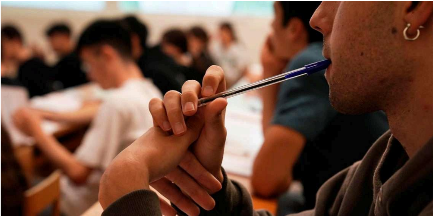
Estudiantes gallegos realizando la ABAU 2023