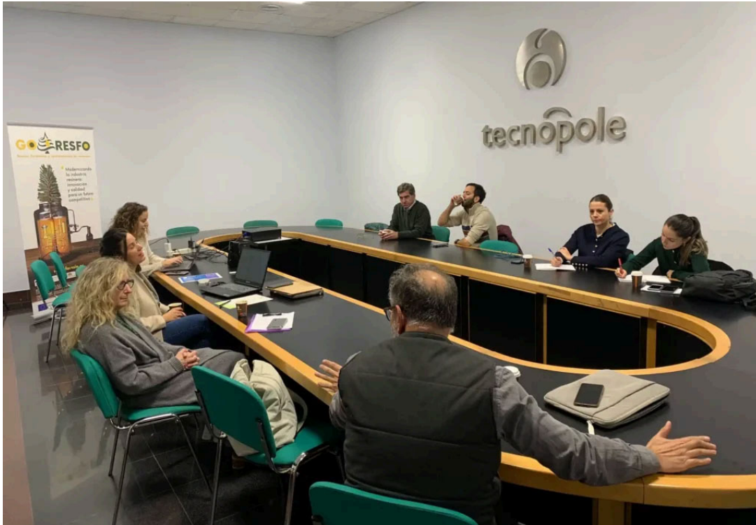
O Grupo Operativo RESFO é o responsable de desenvolver o proxecto.