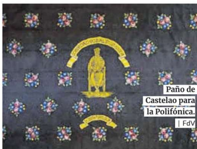
Paño de Castela para la Polifónica.