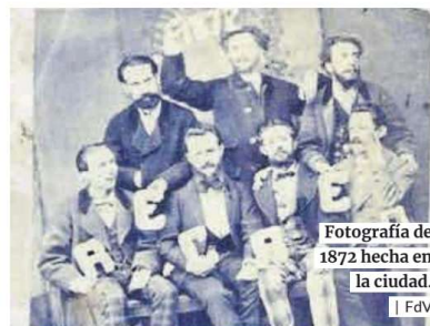
Fotografía de 1872 hecha en la ciudad.

rán al público sus obras y su progresión artística. En el caso de Varela, destaca la fuerza del color de sus trabajos, mientras que Ruibal representa el teatro de vanguardia.