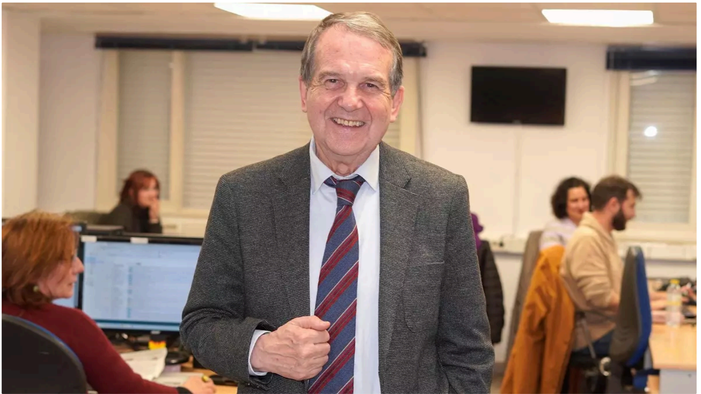
El alcalde de Vigo, Abel Caballero, en una visita a Atlántico para una entrevista.