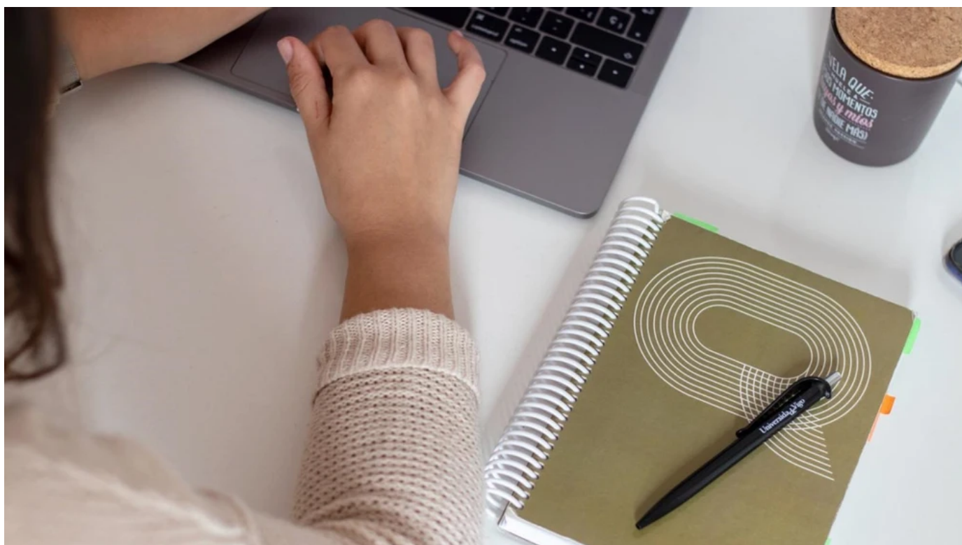
▲ Una estudiante universitaria utiliza un ordenador

Las formaciones más demandadas pertenecen a la informática y la tecnología, los idiomas y las habilidades profesionales