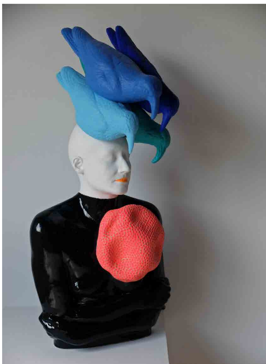
"Mais paxaros na cabeza", 2019. Cerámica. 84 x 39 x 40 cm

IVÁN PRIETO + FÁTIMA OTERO (ARTISTA) (CURADORA)