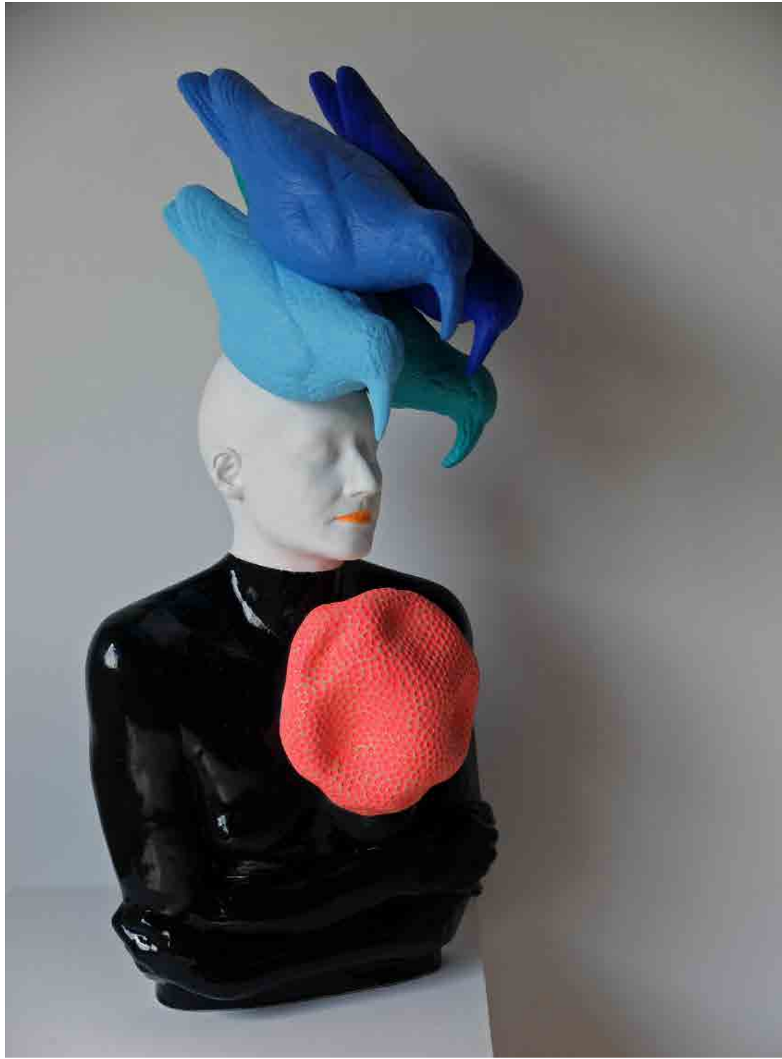
"Más paxaros na cabeza", 2019. Cerámica. 84 x 39 x 40 cm

IVÁN PRIETO + FÁTIMA OTERO (ARTISTA) (CURADORA)