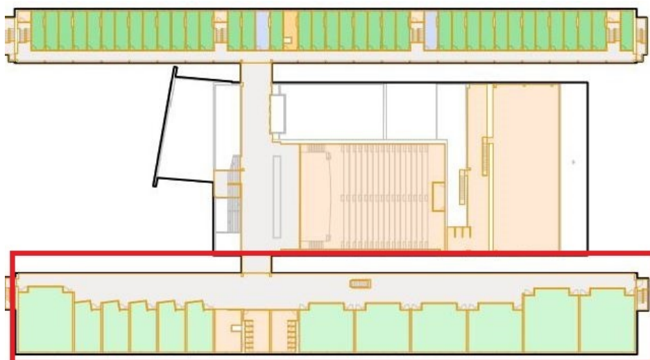
Plano del piso 2º (marcado con rectángulo rojo la zona de aulas)