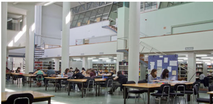
Imagen: Espacio de trabajo en la biblioteca de Filología

Todas las instalaciones generales de uso docente reúnen condiciones de accesibilidad adecuadas para personas con discapacidad. Para garantizar esto se han realizado numerosas reformas, que van desde la reserva y señalización de plazas de aparcamiento hasta el acondicionamiento de los aseos, la instalación de rampas o elevadores o la adecuación de los ascensores. Aun así, una parte de los despachos de los profesores y algunas dependencias de la biblioteca resultan inaccesibles para personas con movilidad reducida. Los problemas derivados de esta situación se han afrontado mediante la