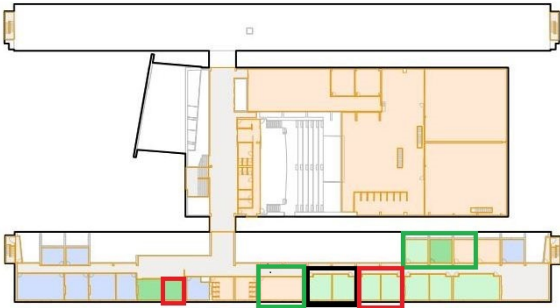
Plano del piso 1: Aulas (marcadas en rojo), salas de videoconferencia (verde) y laboratorio de idiomas (negro)