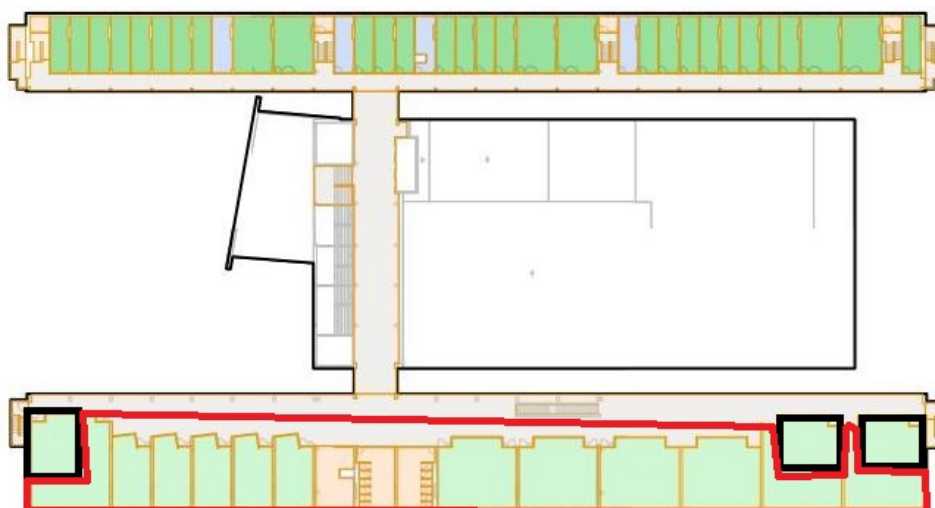
Plano del piso 3º (marcado en rojo la zona de aulas y en negro los tres seminarios)