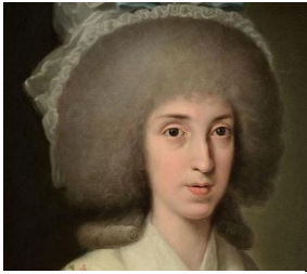
María de Guzmán, primeira doutora nunha universidade española (1875) pola Universidad de Alcalá

Premios Doutora de Alcalá a novas investigadoras (CC Experimentais e CC Humanas e Sociais) e Doutora de Alcalá á excelencia investigadora (CC Experimentais e CC Humanas e Sociais) +Info