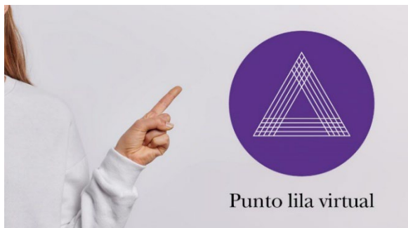
Imaxe do Punto lila virtual dispoñible no espazo web da Unidade de Igualdade en galego e inglés.

Recursos contra as violencias machistas da UVigo (GA/EN) +Info