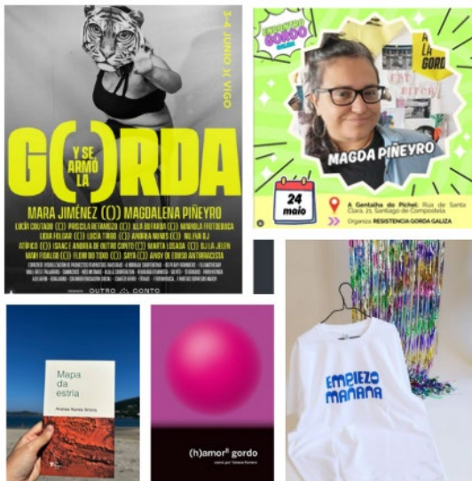
Escolma de iniciativas sobre activismo gordo galegas e estatais

de fondo configuran un escenario no que se decide quen é lexítima, quen merece visibilidade e quen pode ocupar espazo público.