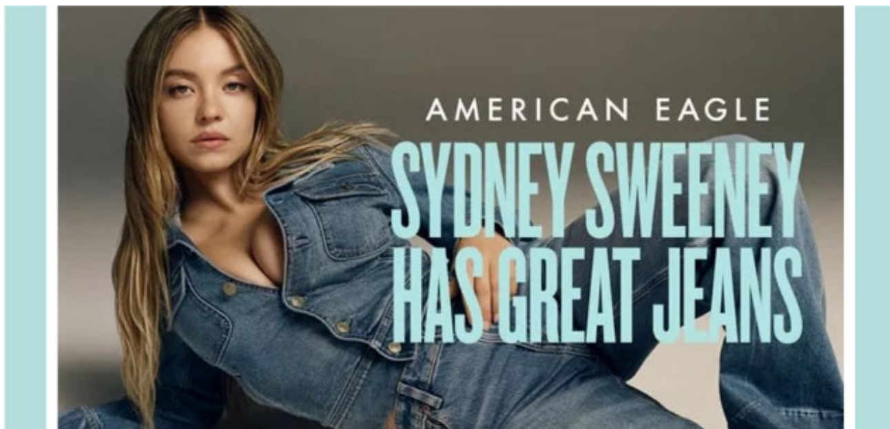
Anuncio dunha que xoga coas palabras «xenes» e «vaqueiros» ( genes e jeans en inglés)

A finais do verán a campaña dunha marca de pantalóns vaqueiros provocaba a última polémica sobre a sexualización do corpo dunha muller, neste caso mesturado coa controversia pola orixe étnica, os estándares de beleza occidentais e as críticas contra o wokismo .