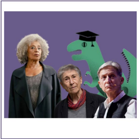
Angela Davis, Silvia Federici e Judith Butler

Isto tamén incide en como nos achegamos ao pensamento de referentes como Angela Davis, Judith Butler ou Silvia Federici, por citar algunhas das máis populares, que se converteron en figuras famosas e seguidas a nivel mundial, o que supón un maior recoñecemento do feminismo académico. Sen embargo, este interese non se traslada á lectura e o debate da súa obra o que supón un achegamento algo máis superficial e limita a posibilidade de incidencia das súas propostas na transformación social para á igualdade de xénero.