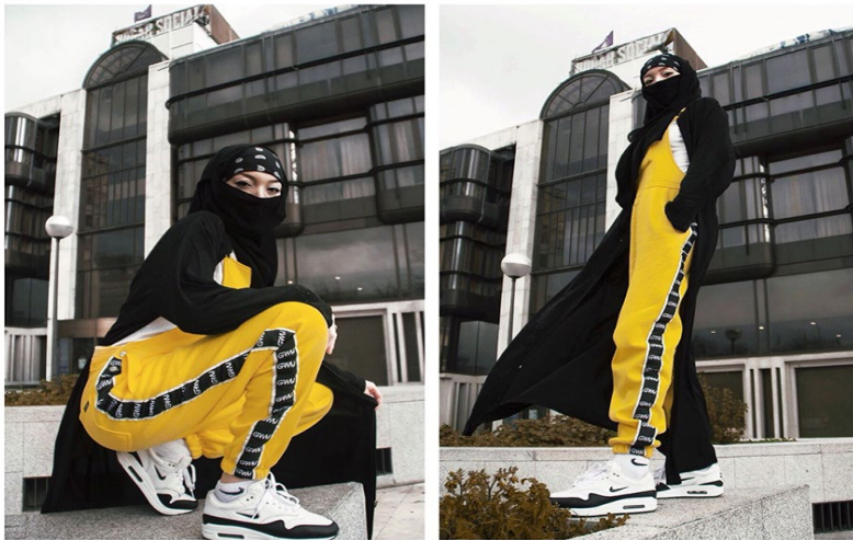
Imaxes do traballo fotográfico de Iman El Azrak «Two faces»

Por outra parte, moitas mulleres musulmás, incluídas feministas, afirman que o uso do veu islámico pode ser unha elección consciente, ligada á identidade, á fe ou mesmo á protesta fronte a unha sociedade que estigmatiza os seus corpos e a súa presenza. Neste sentido, denuncian que unha prohibición veu, especialmente en Europa, reproduce unha vez máis a lóxica colonial: preséntase como salvación, pero en realidade retíralle ás mulleres o dereito a decidir como aparecer en público, condicionando o acceso á escola, ao emprego ou aos servizos se non se adaptan ao código de vestimenta imposto polo Estado.