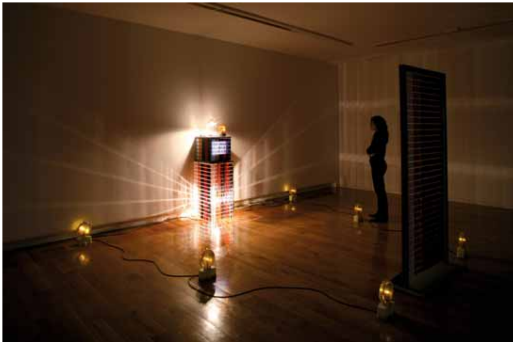
Ficcions analóxicas. O vídeo na Galicia dos oitenta.

Centro: Facultade de Belas Artes de Pontevedra